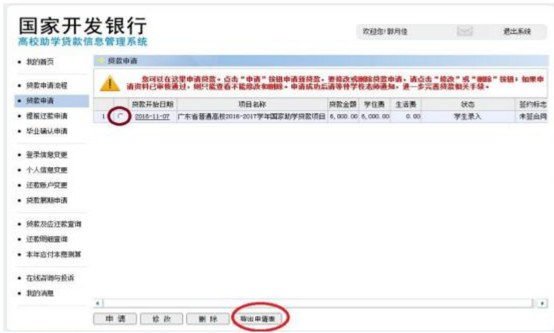
国家开发银行股份有限公司高校助学贷款申请表

【3】申请成功后，会有一申请记录生成，选择该笔合同，导出申请表，打印签字并到资格审查部门（村民（或居民）委员会或以上人民政府（民政部门））盖章。